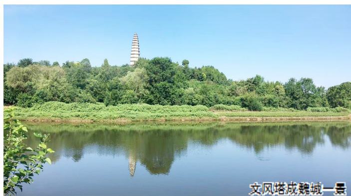
文风塔成魏城一景

在游仙魏城东边矗立着一座高大的古塔——文风塔，这已成为当地的一大地标性建筑。该塔始建于清朝，其初衷是倡导文风，富泽乡民。如今，经过一百多年时间的流转，这座古塔，揽日月精华，聚浩荡文风，高挺笔直的身姿，与周边山河组成了一道漂亮的风景。近日，记者在魏城本地文史研究者的带领下，探访了这座百年古塔。