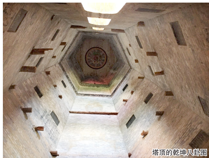
塔顶的乾坤八卦图