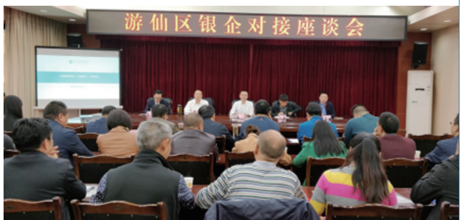
游仙区银企对接座谈会

此外，提出贷款期限内，支持随借随还的贷款方式，可通过企业网银、个人网银、个人手机银行、柜面等多种渠道完成贷款支用、查询、还款等操作。保障企业可以根据生产需要进行资金支用，解决了企业在资金困窘期的成本问题，降低了企业综合贷款成本，让企业得到了实惠，进一步促进了企业的发展。