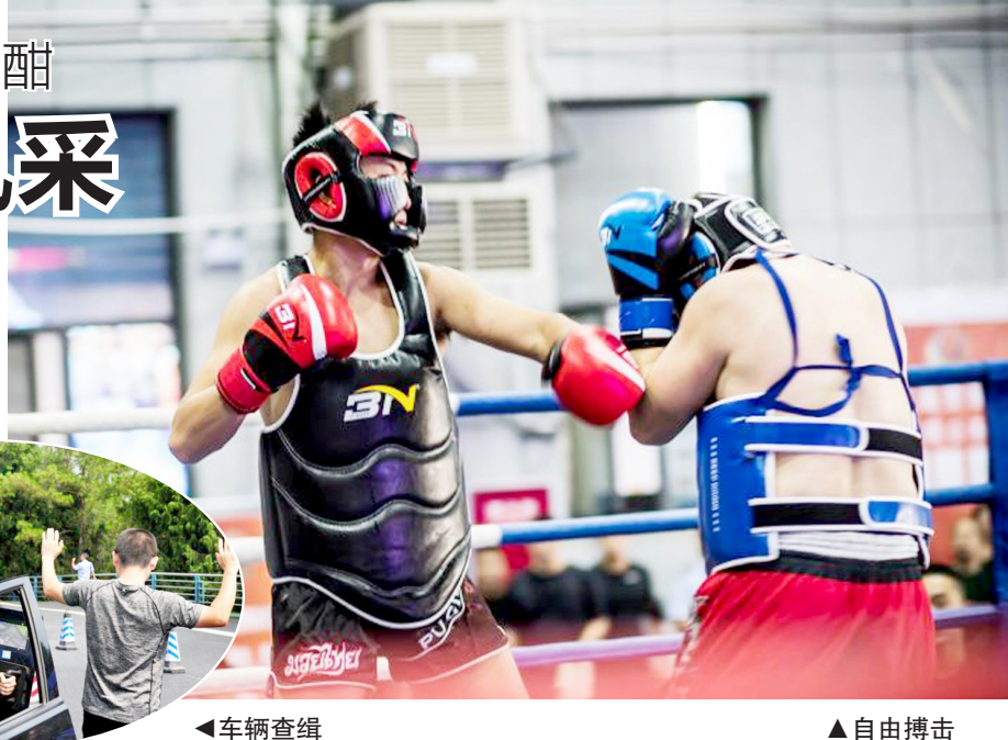
车辆查缉 自由搏击

参赛选手日常工作相关，比如“大海捞针”项目，参赛选手需要在一大堆模糊人像中，找到“嫌疑人”画像，从而锻炼选手过目不忘的能力。