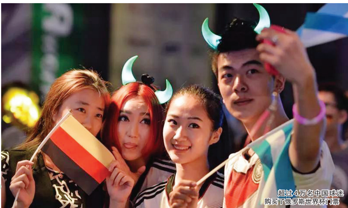
超过4万名中国球迷购买了俄罗斯世界杯门票