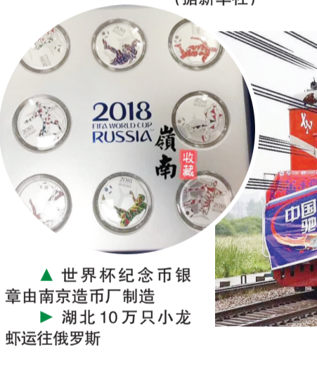
世界杯纪念币由南京造币厂制造 湖北10万只小龙虾运往俄罗斯