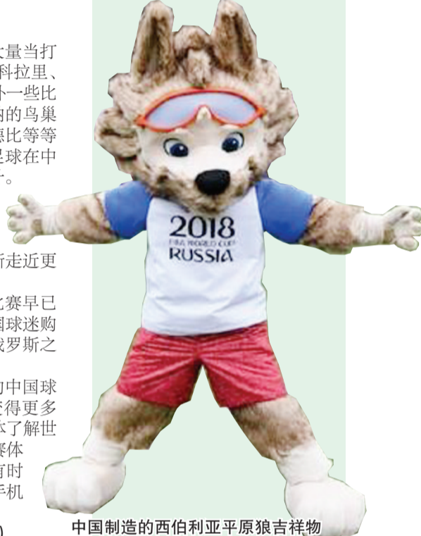
中国制造的西伯利亚平原狼吉祥物