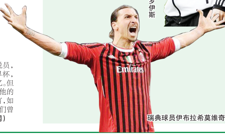
瑞典球员伊布拉希莫维奇