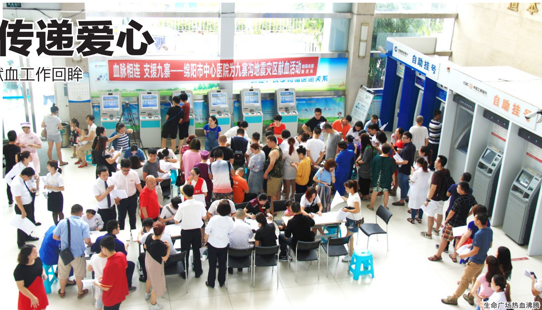
生命广场热血沸腾