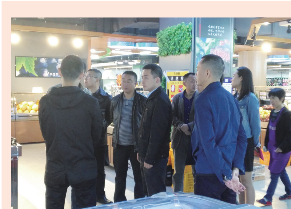
游仙区政府分管领导带队检查世纪联华超市安全生产工作

同时,严格执行安全生产监察执法制度。全区负有安全生产监督管理职责的部门不断加大监察执法力度,突出抓好安全生产任务重、事故多发的单位、重点行业领域和高风险企业检查,对检查发现的每一项违法违规行为,依法严格落实查封、扣押、停电、吊销证照和停产整顿、关闭取缔、上限处罚、追究法律责任和“四个一律”等执法措施。形成高压态势,坚决遏制和有效防范较大及以上事故发生。去年以来,区委巡察办开展2轮安全生产