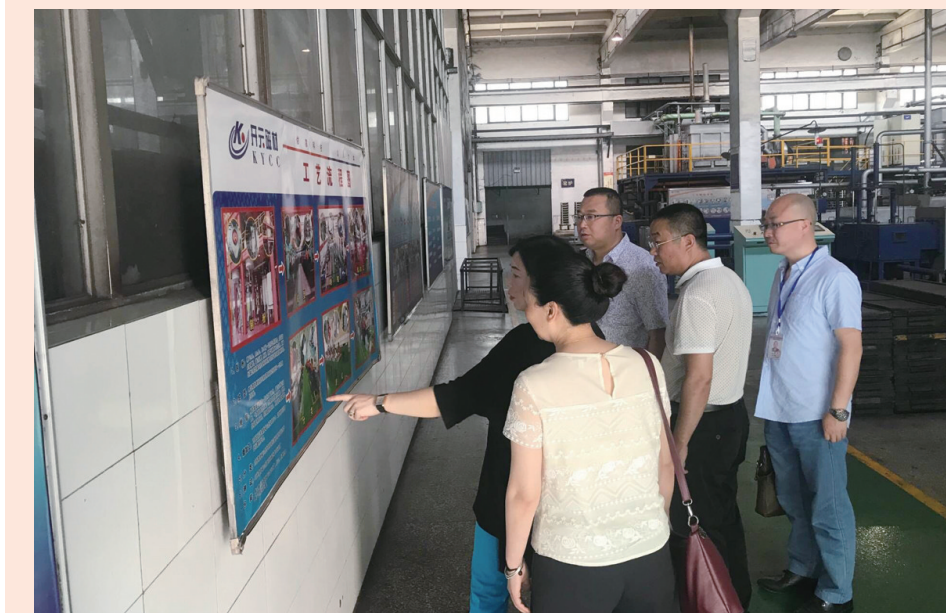
游仙区人大常委会领导带队检查开元磁材落实《安全生产法》情况