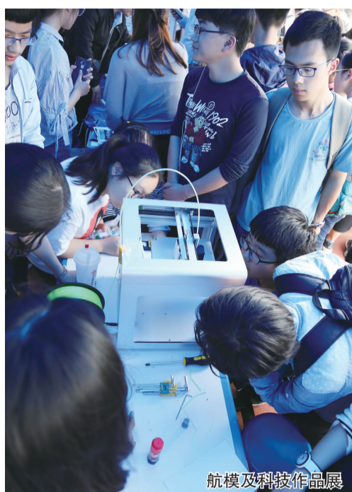
航模及科技作品展

科学之真、人文之善、艺术之美,是绵中科技节一直高举的守正出新的旗帜。绽放科技才华,展示多元智能,放飞科学梦想,绵中学子一直走在不断创新的道路上。