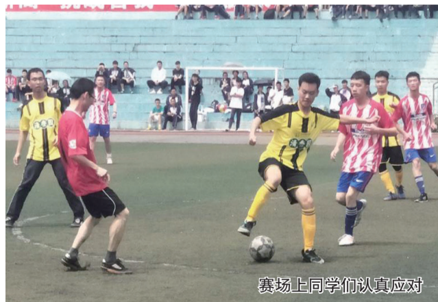
赛场上同学们认真应对

本报讯(唐德宁)4月以来,秉持着提升学生身体素质的原则,按照学校体育组的学生活动安排,江油中学高2016级学生足球比赛有序推进。对此,高二年级积极应对,认真备赛。