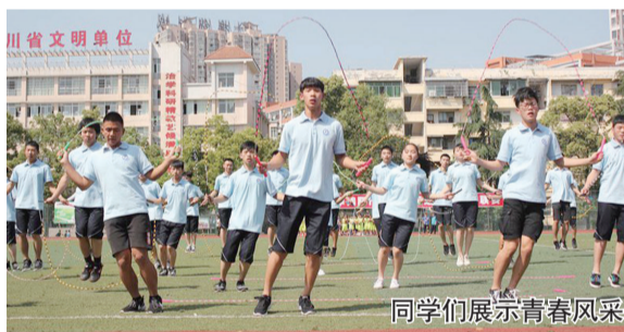
同学们展示青春风采

据悉,此次校园文化体育艺术节为期三天,将先后进行田径运动会、各年级大课间活动展示、校园足球班级联赛、教工运动会、文艺汇演等文化和体育艺术活动,