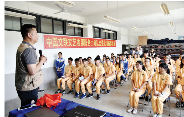
为北川中学学生上摄影课