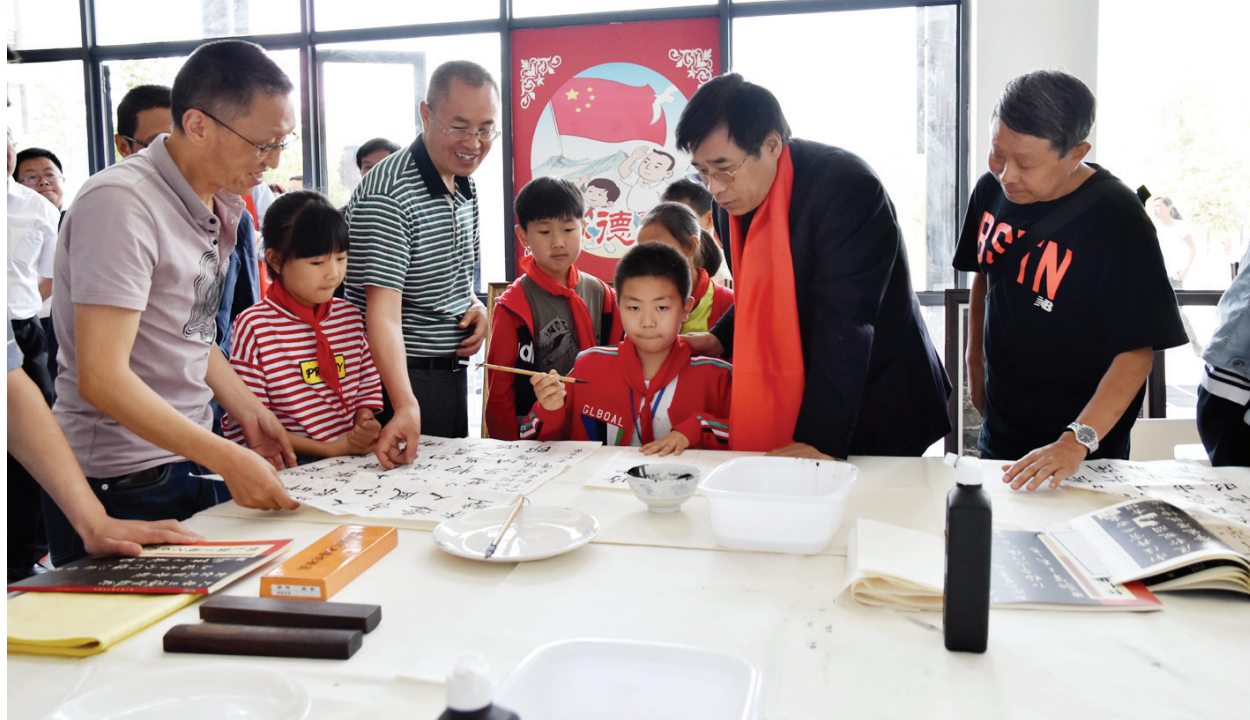
在北川中学辅导学生书法写作