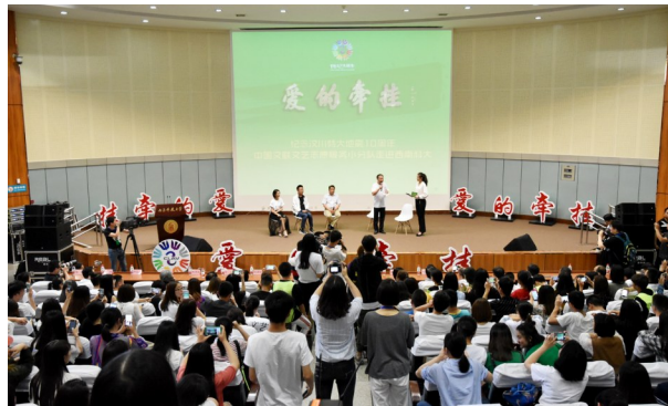
与西南科大师生倾情对话