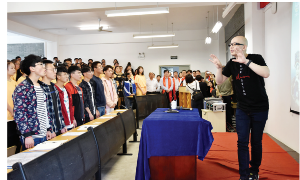
青年歌手平安为北川中学学生上音乐辅导课