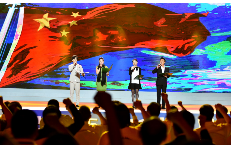
张凯丽、岳红、林永健、陈晓诗朗诵《中国，雄起》