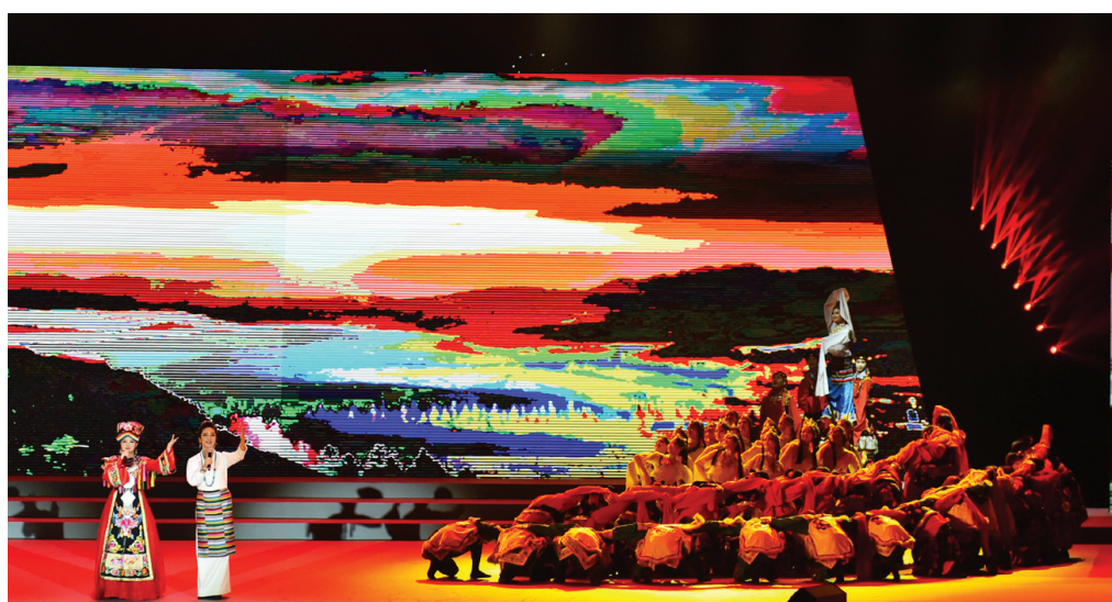
歌舞《唱支山歌给党听》