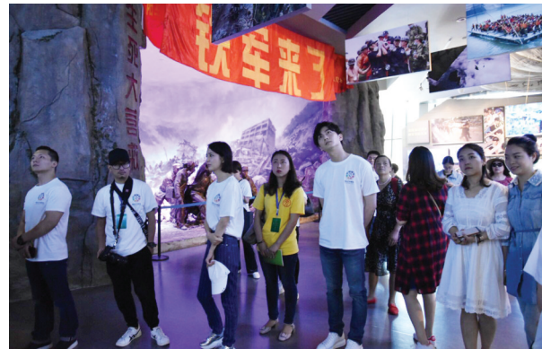
参观5·12汶川特大地震纪念馆