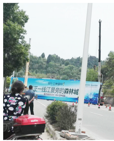
345KM+950M处马家桥路段存在安全隐患的横跨公路大型广告牌进行了拆除(如图)。在排查中发现该大型广告牌横跨省道绵三路整个有效路面,支撑的铁架已经严重锈蚀,如遇大风、暴雨,后果不堪设想,对过往车辆和行人的安全存在极大的安全隐患。经过2个小时的临时交通管制,该广告目前已顺利拆除,消除了安全隐患,保障车辆的安全通行。

据悉,汛期将至,市交通运输局路政管理支队在各管路段开展汛期安全隐患排查整治工作。对管辖范围内的公路、桥梁、隧道、涵洞存在的安全隐患、地质灾害安全隐患进行全面排查,对于排查出的隐患,查出一处就落实整改一处;另外还联系广告设置方,对公路两侧设置的广告标志牌进行全面的隐患排查,对存在安全隐患及时向设置方提出整改意见,并全程监督整改落实。