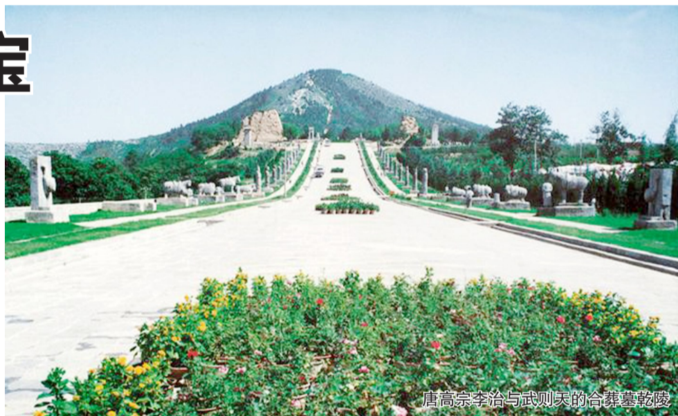
唐高宗李治与武则天的合葬墓乾陵

院以深邃的内涵和珍贵的文物每年吸引数百万国内外游客来此参观,秦兵马俑博物馆已接待200多位国家元首。