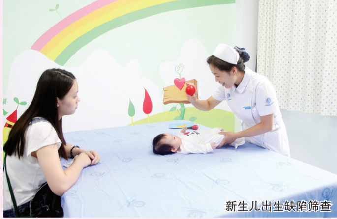
新生儿出生缺陷筛查