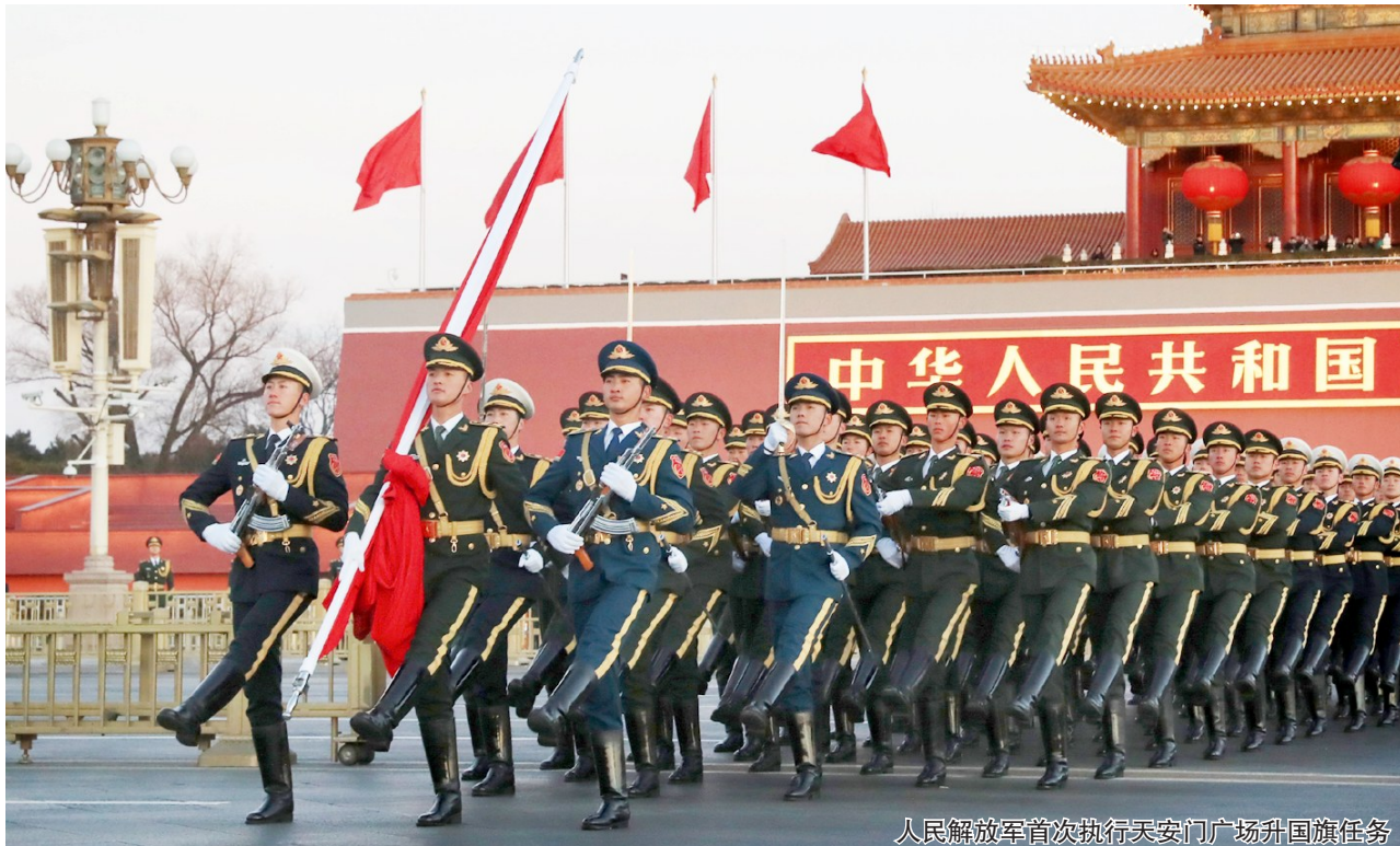
人民解放军首次执行天安门广场升国旗任务