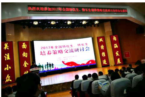
2017年全国特优生、特长生培养策略交流研讨会现场