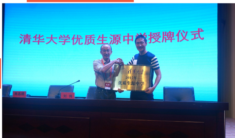
清华大学2017年优质生源基地中学授牌仪式

新的一年孕育新的希望，新的历程承载新的梦想。2018年，南山中学将迎来一百一十周年华诞，变迁的是历史，传承的是文化，传播的是品牌。南山中学将以校庆为契机，进一步梳理办学思路，整合办学资源，提升办学品质，全力推进“优质化、特色化、现代化、集团化、国际化”的办学目标，以激情点燃南山的教育梦想，以实干续写南山的锦绣华章，以崭新的姿态为伟大的中国梦贡献南山力量！