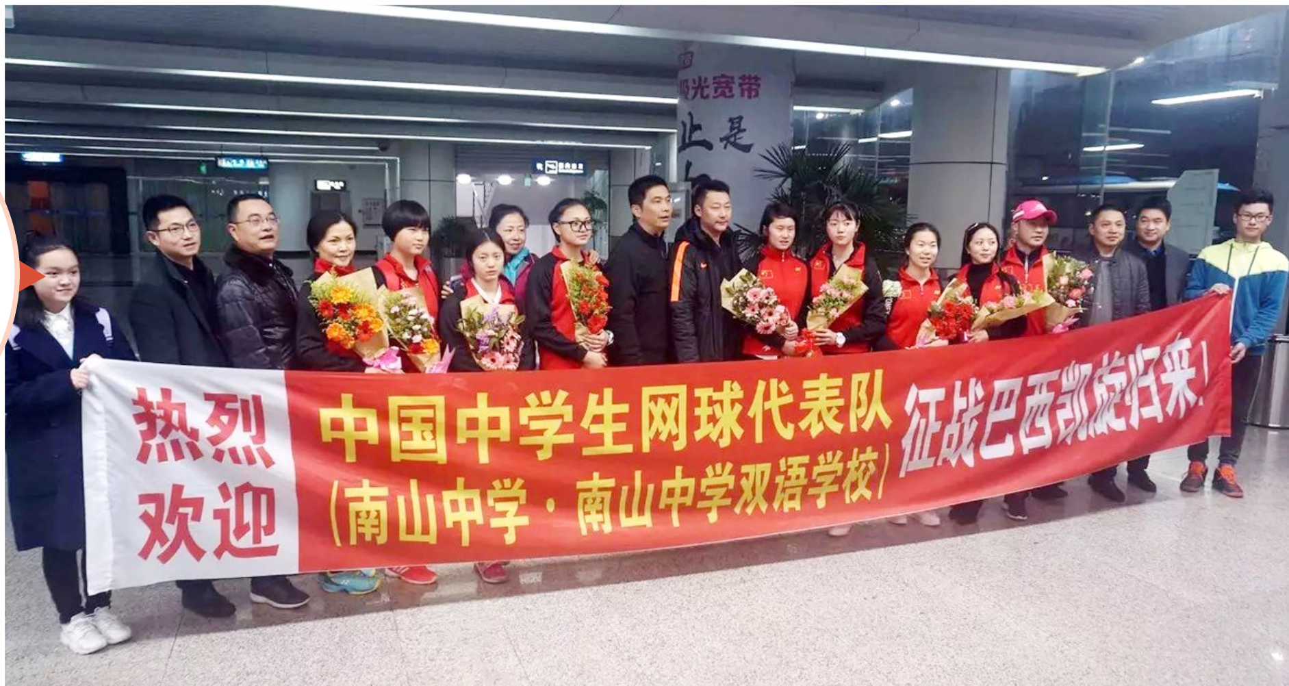
南山中学网球队代表中国参加世界中学生网球锦标赛，跻身前六强

岁月流金，盛世丰年。在新年钟声即将敲响之际，南山中学党委书记、校长唐江林携全校师生员工向关心和支持南山中学发展的各级领导和社会各界人士，向奋斗在各个岗位、为南山中学的发展竭尽全力的老师，向理解和信任南山中学的学生及其家长，表示衷心的感谢和诚挚的祝福！ 精彩2017，憧憬2018。团结智慧的南山人，瞄准拔尖创新，着力多元成才，在追逐教育梦想的征程上取得新的业绩，实现新的跨越。