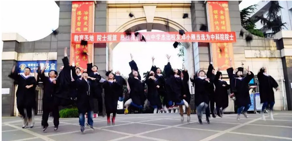
新加坡公派留学项目

3月12日至3月20日，南山中学网球队代表中国参加在巴西举行的2017年世界中学生网球锦标赛，历时七天鏖战，获得世界第六名，刷新中国中学生网球队在世界上的排名。