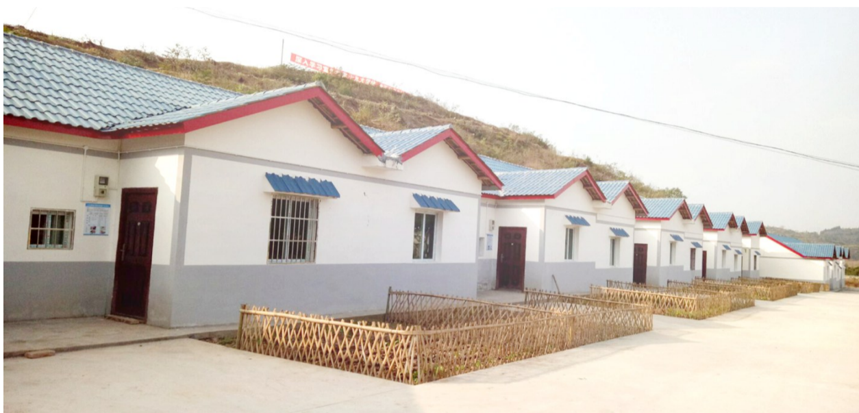
三台县乐安镇断山村统规联建“微田园”住房聚集点

广、因地制宜落实,在建设过程中,突显了本土特色,引领新村聚居建设。三台县、江油市、梓潼县、盐亭县、涪城区、游仙区、仙海区结合易地扶贫搬迁、D级危房改造和“四好”新村建设,推动形成协调一致的农房风貌;平武县将农房图集推广纳入年度目标绩效考核;三台县向农发行贷款筹备资金进行推广补助,严控审批环节,将补助