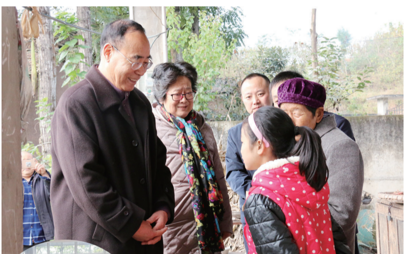
「五老」实地慰问「事实孤儿」

随着一系列措施的落实，“事实孤儿”在生活、学习、治病和心理障碍等方面问题逐步得到有效解决，关爱救助“事实孤儿”工作也不断取得新成果。