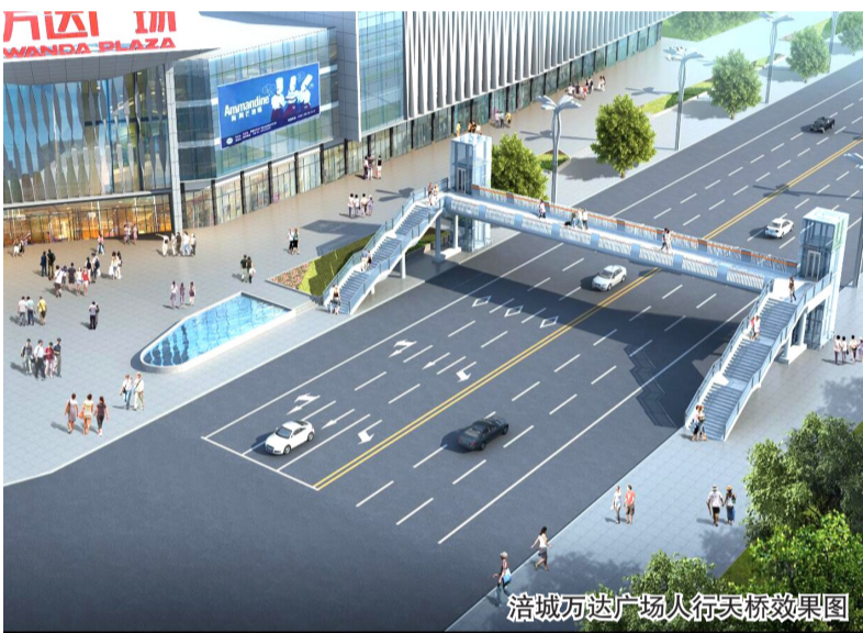
涪城万达广场人行天桥效果图

除了人行天桥项目以外，我市还同时启动了警钟街北街口人行天桥加装垂直升降电梯工程。目前，该工程已进场实施管线迁改等工作，施工期间不会对周边道路实行交通管制。