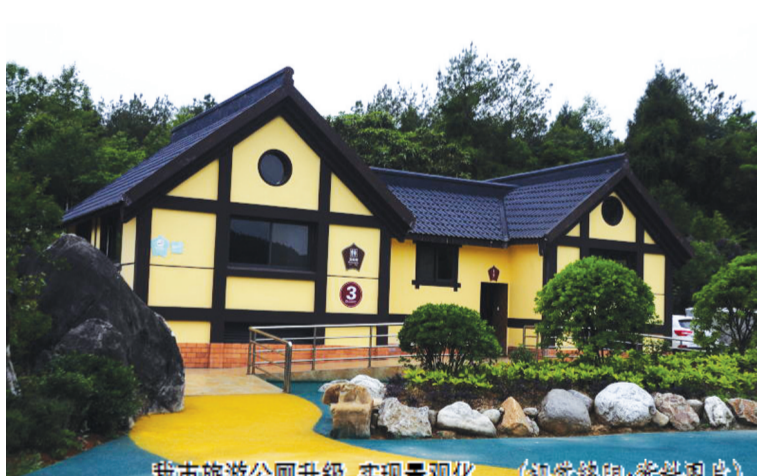
我市旅游公厕升级,实现景观化