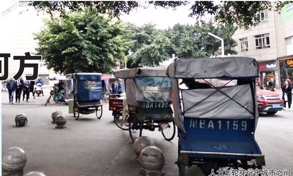
人力三轮车穿梭于城市之间

随着交通工具的多样化,加之人力客运三轮车存在的一些问题,是否意味着人力客运三轮车将退出历史舞台。面对城区众多人力客运三轮车,如何进行有效管控,让管理者、乘坐者、营运者三方满意?近日,记者采访了部分市民、专家学者以及人力客运三轮车师傅,他们认为,只有找到契合市场需要的经营之道,人力客运三轮车才会更好地“发挥作用、实现价值、赢得尊重”,实现破茧成蝶,发挥应有的交通功能。