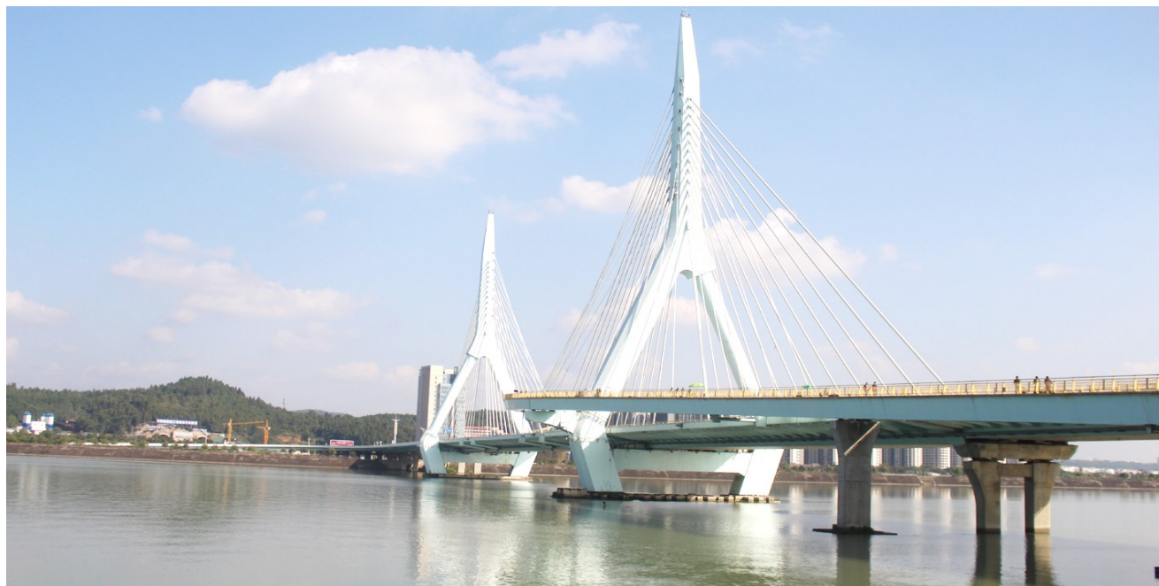
我市切实加强大气污染防治 呵护美丽绵阳蓝天白云