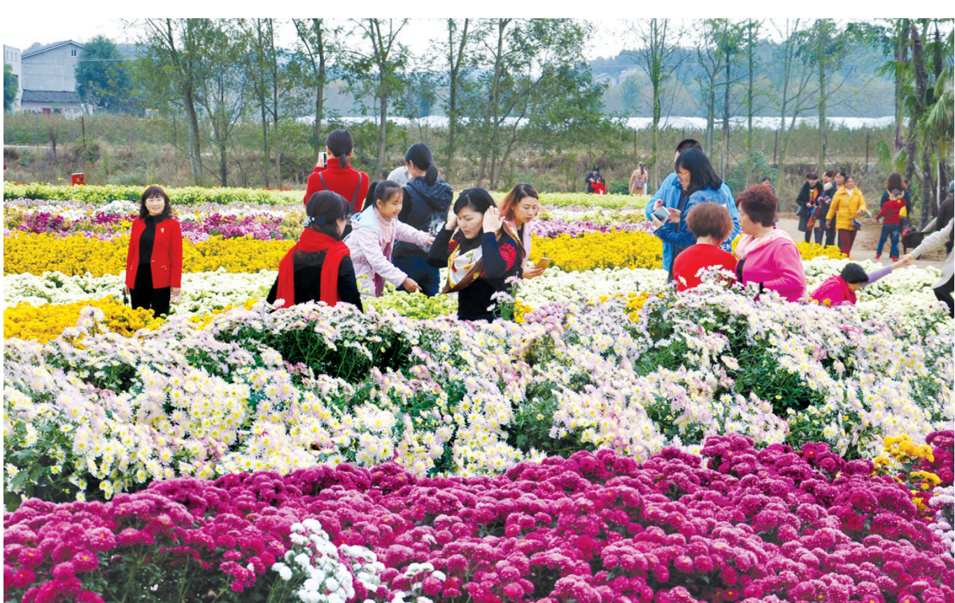
10月28日，绵阳国际兰花主题公园菊花主题园菊花展开展，白菊、黄菊、非洲菊，百万盆菊花绽放成海，大花蕙兰、蝴蝶兰、卡特兰，十万盆兰花幽然成香，整个兰花公园万紫千红，成为绵阳及周边县市游客休闲观光的好去处。本次活动除菊花展外，还有兰花火锅、兰花宴、兰花小吃等各种以兰花为主题的特色美食，以及迷宫跳跳床、快乐行走架、勇士攀爬网等多个亲子娱乐项目。活动将持续到11月底结束。图为，游人在公园里赏花。

截至目前，游仙区围绕“整治群众身边的不正之风和腐败问题”开展主题式警示教育4次，旁听庭审2次，573名党员干部受到警示。同时，该区用活通报曝光这一利器，今年以来，共对21件典型案例进行点名道姓通报曝光，形成强大警示震慑。