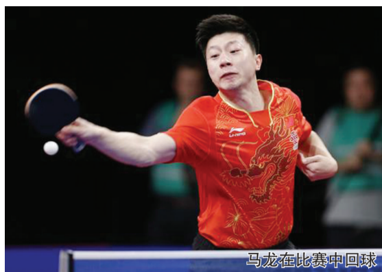
马龙在比赛中回球

最后一球出界，在现场观众的呐喊声中，马龙平静地与对手和裁判握手致意，收拾好装备，然后快速离开比赛场地。 2017国际乒联男子世界杯半决赛22日展开，和21日晚的林高远一样，“龙队”在3:1领先的情况下，被德国36岁老将波尔淘汰出局，无缘决赛席位，中国队在2009年后再次无缘男乒世界杯冠军。 结果令人沮丧，但马龙身上有多处一直未对外公布的伤情，他在带伤作战的情况下，依然与实力强劲的赛会三号种子波尔战至最后一分，令人不由赞叹其作为一名高水平运动员的职业精神和顽强意志力。 据记者从国乒队内了解到，马龙的手腕、腰部和膝关节均有不同程度的伤情。他代表北京队参加了全运会赛事，并且卫冕了男单冠军。全运会后马龙一直没有参加系统训练，主要以伤病恢复为主，按照计划，11月初马龙将赴德国慕尼黑一家运动康复医院治疗。身为世乒赛冠军和“大满贯”得主，马龙在身体多处有伤的情况下，还是决定参加在列日举行的男子世界杯，正是出于对推广乒乓球运动在世界范围内发展的考虑。 世界杯赛程短，头号种子马龙无需参加第一阶段小组赛，从16强战到决赛，淘汰赛阶段总共只有两天赛程，一日双赛的紧凑赛程无疑加剧马龙身上的伤势。 赛后马龙没有接受采访。在2017年这个后奥运年，马龙用他的世乒赛冠军和两站国际乒联分站赛冠军证明在东京奥运周期内，他还是国乒阵中表现最稳定和让人放心的队员，人们也有理由对伤愈后“满血”归来的“龙队”满怀期待。