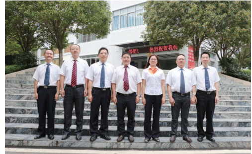
务实创新的校党委领导班子