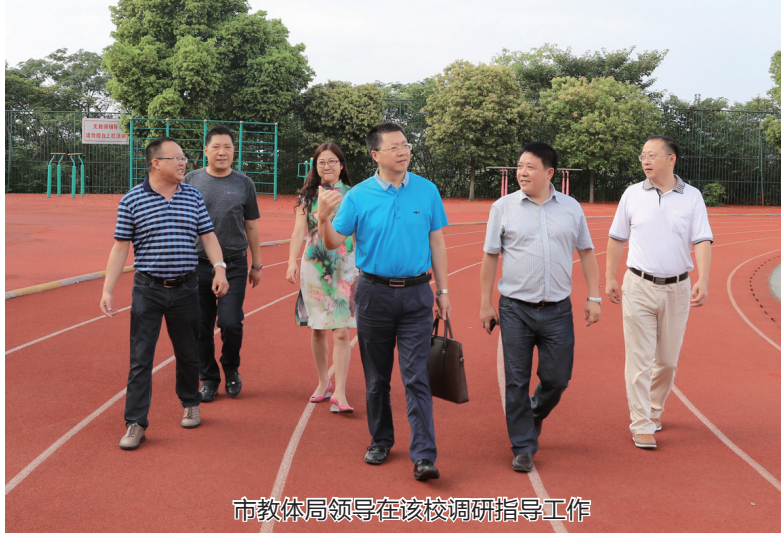
市教体局领导在该校调研指导工作