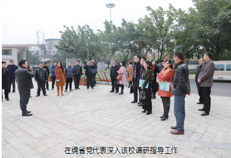
在绵省党代表深入该校调研指导工作