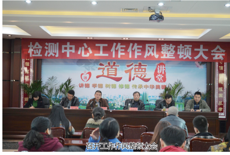
召开工作作风整顿大会

年检测报告无差错率达99%、及时率达95%、客户满意率达95%以上的质量目标;认真开展实验室内部审核和管理评审工作,确保检测工作的合法性、规范性和有效性,严把建设工程质量检测关。严把制度完善管理关,完善检测手段和程序,保证检测工作的公正性、准确性和科学性。按照中心制定的《质量手册》,实行见证取样制度,检测实行盲样试验,记录实行计算机采集和人工记录双录制,外出检测实行双人制,检测前后仪器设备实行检验等制度,严把建设工程检测工作入口关、过程关和出口关。在加强内部管理的基础上,不断要求职工要转变观念,树立优质服务、诚信检测的意识,把以“客户为关注焦点”的理念始终贯穿到检测工作的全过程,注重服务质量,讲求信誉,树立品牌。为此,该中心多次受到省、市质量技术监督局的表彰,多次被省建设厅、省质安总站评为“四川省建设工程质量检测工作先进单位”。