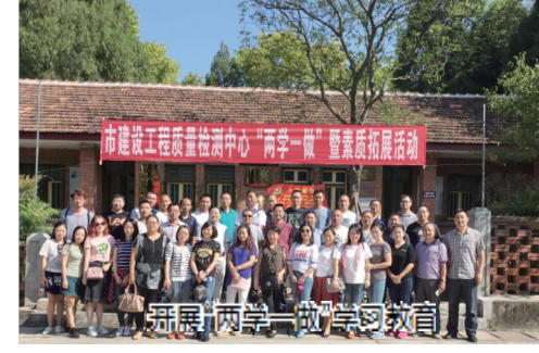
开展“两学一做”学习教育

该中心在“5·12”特大地震和芦山“4·20”地震这两次地震中表现突出,他们不仅向地震灾区捐款捐物,还积极调动相关的设备、资金和技术人力等资源紧急奔赴灾区,对两次地震受损的房屋进行应急安全鉴定和抢险工程实行免费检测,受到省、市相关部门的充分肯定。