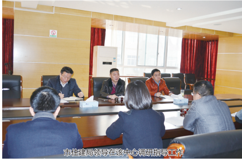
坚持以党建为引领 夯实基层战斗堡垒

该中心党支部坚持以党建工作为引领,认真贯彻落实党的十八大和十八届四中、五中、六中全会精神,以习近平总书记系列重要讲话精神为引领,不断加强党的建设、队伍建设、作风建设,着力提高队伍整体素质,紧紧围绕“发展”与“和谐”两大主题,深入开展了“中国梦”、“党的群众路线教育实践活动”、“三严三实”和“两学一做”学习教育,保证了党建工作有规范、管长远,扎实有效地开展党风廉政风险防控工作和工作作风整顿,始终保持惩治腐败的高压态势,维护了干事创业、风清气正的良好政治生态。