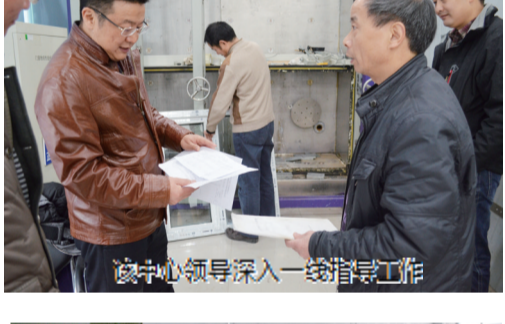
该中心领导深入一线指导工作