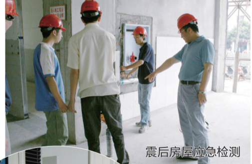
震后房屋应急检测