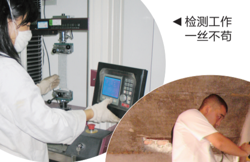
检测工作一丝不苟