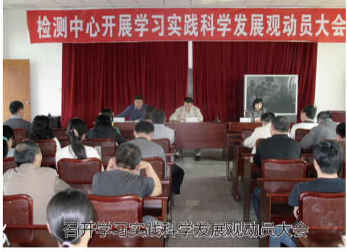
召开学习实践科学发展动员大会