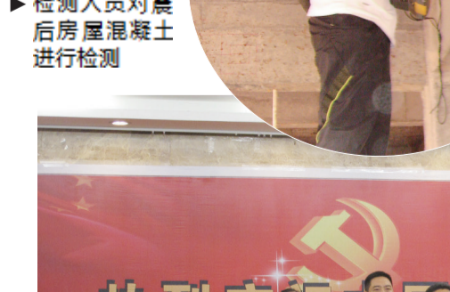
检测人员对震后房屋混凝土进行检测