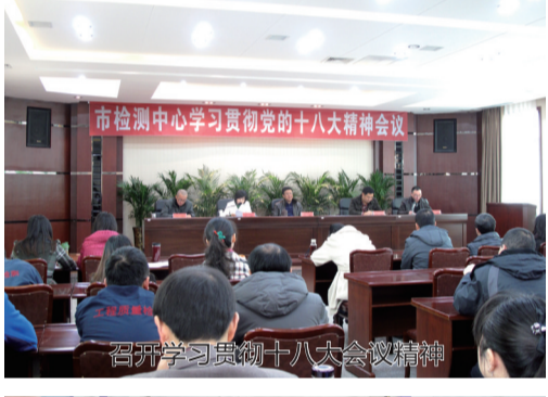
召开学习贯彻十八大会议精神