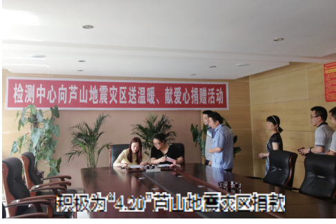
捐赠为“4·20”芦山地震灾区捐款

牢固树立“百年大计、质量第一”的质量意识,严把工程质量检测关。该中心始终坚持建设行业和计量认证的相关法律、法规指导检测工作,不断对已取得检测资质的检测项目按现行国家行业标准修订作业指导书,检测工作都必须严格按照作业指导书的规定完成。以《实验室资质认定评审准则》为基准,不断完善质量管理体系,向社会公众发出了“检测公正性声明”,实现了全