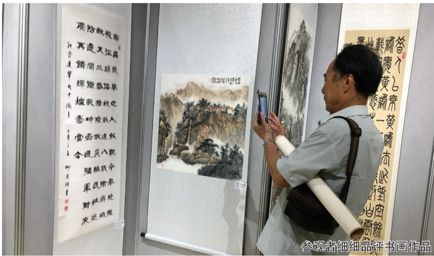
参观者细细品读书画作品

据悉,市老年书画研究会汇集了一批离退休老干部、老职工中的书画爱好者。他们年轻时接受党的教育培养,为祖国建设和发展做过贡献,退休后坚持研习书