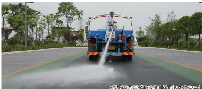
绵阳市委党校的完工路面透水性展示

积、自然渗透、自然净化的海绵城市”，全国迎来了海绵城市建设潮，同时靛固公司也迎来了新的发展机遇，但机遇总是伴随着挑战，此时全国透水铺装产品骤然剧增，而服务质量却良莠不齐，甚至开始出现一些恶性竞争，由于缺乏明确的标准，用户在选择产品中很难抉择。