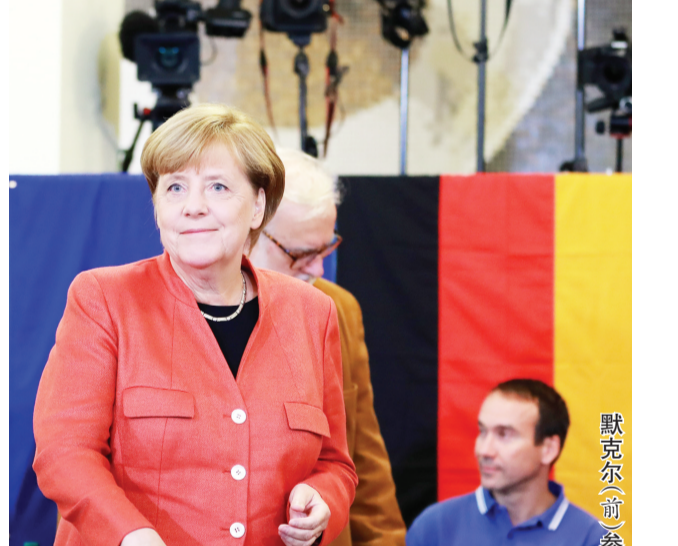
默克尔（前）参加联邦议院选举投票