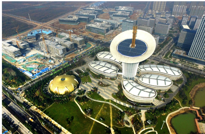
武汉东湖高新区六大园区之一的武汉未来科技城

重要“战略支点”，河南发挥“支撑作用”，安徽成为“创新极”，湖南提出“开放崛起”，红色江西绿色崛起，山西争当能源革命排头兵。 5年内，百万大学生留汉创业就业、百万校友资智回汉……武汉“双百万”计划一经推出，立即引爆全国新一轮“人才争夺战”。新规施行至今100余天，已有5万多名大学生落户武汉。各地“求才若渴”之心，成为当前中部省市抢抓机遇、加快发展的生动注脚。