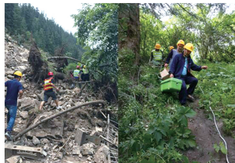
抢险队进行干线检查和整治