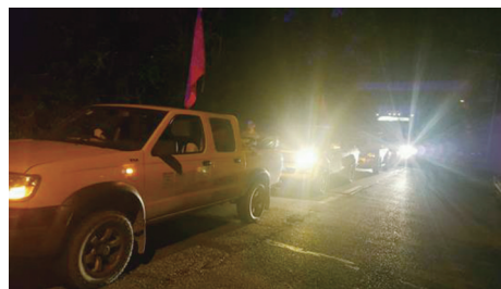
绵阳电信抢险队连夜驰聘赴灾区

8月8日21时19分,一场7.0级强震震裂阿坝州九寨沟县!顷刻之间,山崩地裂,房屋垮塌,生命消殒,“人间天堂”遭受炼狱之殇!震后,灾区大量通信设施损毁,阻断了亲人之间的联系,延缓着救援队伍的脚步……经历了“5·12”特大地震洗礼的中国电信绵阳分公司第一时间响应灾情号令,用感恩情怀、无私大爱和责任担当,在九寨沟灾区打响了一场通信保卫战!