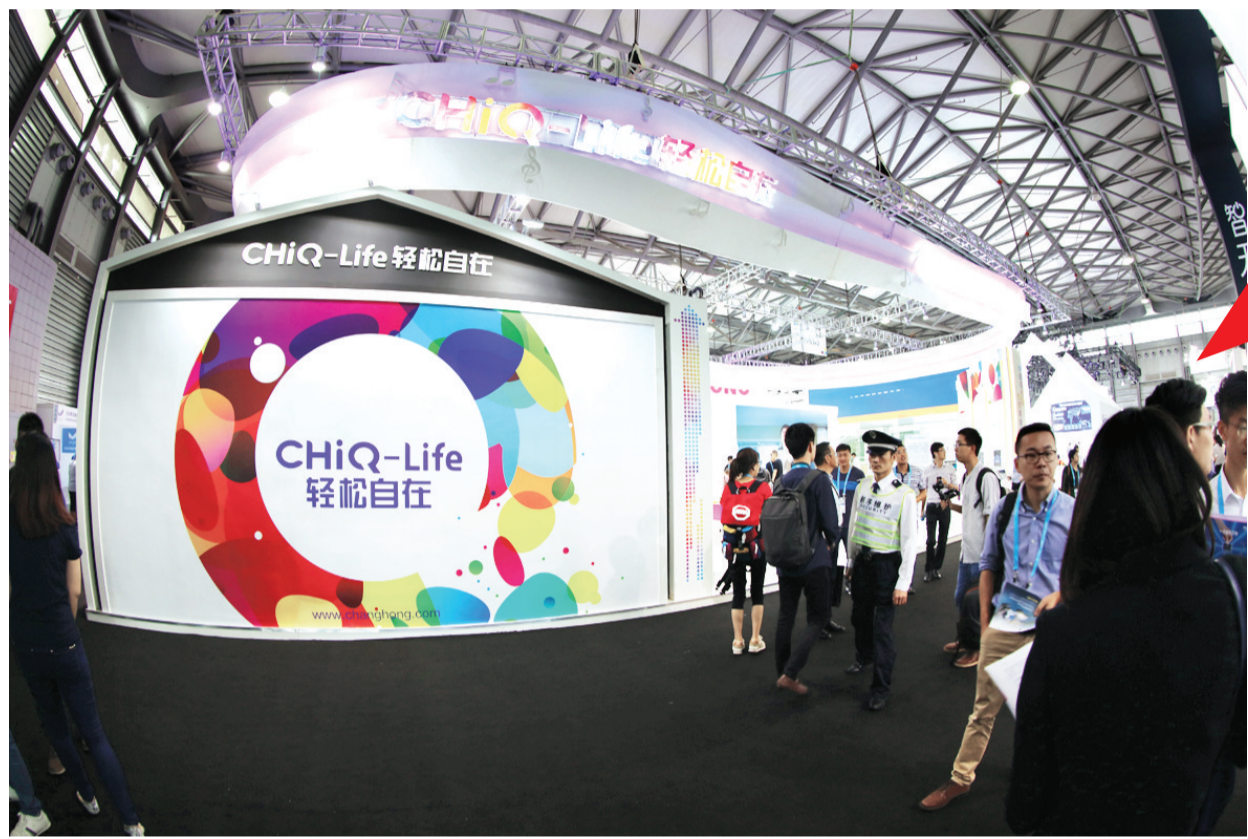
长虹智慧家庭服务解决方案全面市场化

本报讯(记者 王庆)2017年(第三十一届)中国电子信息百强企业名单日前揭晓,华为、联想、海尔、长虹、海信等位列前十,其中长虹位居第六,比去年上升一位,进一步巩固了其在中国电子信息制造业的地位。 据悉,中国电子信息百强企业的评选,是根据2016年电子信息产业统计年报数据,通过主营业务收入、市场占有率、技术创新力、品牌影响力、企业社会责任等综合指标评价而得出的。有观察人士指出:“通过这份百强企业名单,可以映射出中国电子信息制造业的格局现状。华为、联想、海尔、TCL、中兴、长虹、海信等企业牢牢占据着第一阶梯。在排名TOP10企业中,每一步提升都意味着企业在研发决策、经营战略、制造实力等环节完成了一次自我超越。2016年,中国经济下行压力加大,在一系列产业政策的推动下,长虹等家电企业逆势上扬,在产品智能化、企业运营与转型升级上创新、调整,最终跻身中国电子信息百强企业第一阶梯。” 去年以来,作为长虹三大核心产