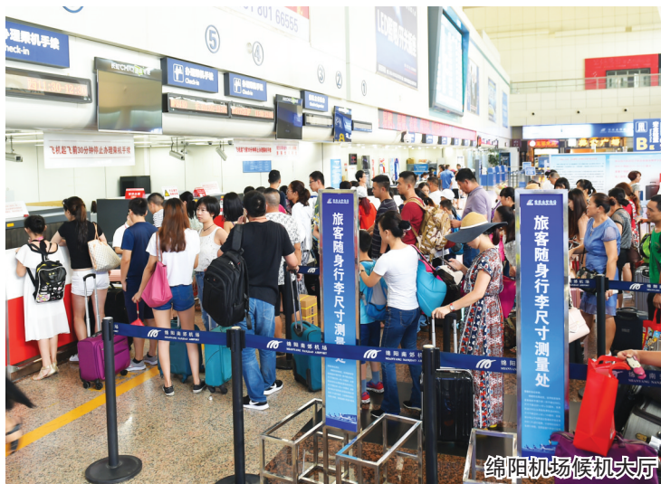
绵阳机场候机大厅

本报讯(记者 李灵越/文 蒲涓/图)继2016年绵阳机场年旅客吞吐量首次突破200万人次后,今年短短7个月时间,旅客吞吐量就再次突破200万人次大关,达到212.5万人次,较去年突破200万人次提前132天!这标志着绵阳民航事业发展再创新高,成为全市开放合作的一个缩影,有力助推了经济社会快速发展。“天路经济”的快速崛起,正成为中国科技城科学发展、加快发展的“新引擎”。