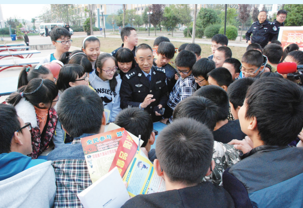
深入学校开展禁毒宣传