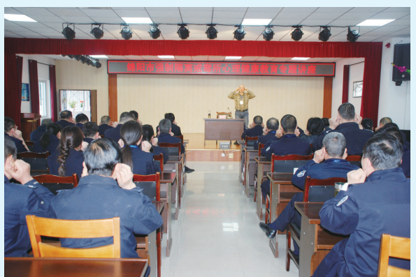
邀请专家对民警进行心理辅导