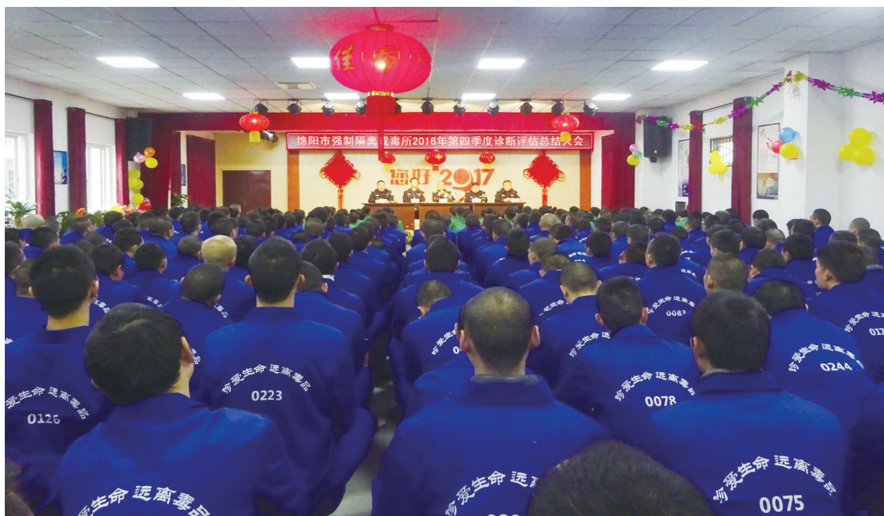
组织戒毒人员召开诊断评估大会