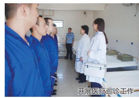
开展医疗巡诊工作

客绵阳广播电视台103.3，从多方面向听众普及禁毒知识。所里组建了禁毒文艺宣传队为全所戒毒人员及来所群众演出，对深化禁毒普法宣传、构建防毒防线起到了良好的促进作用。