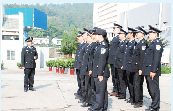
组织民警开展警务训练