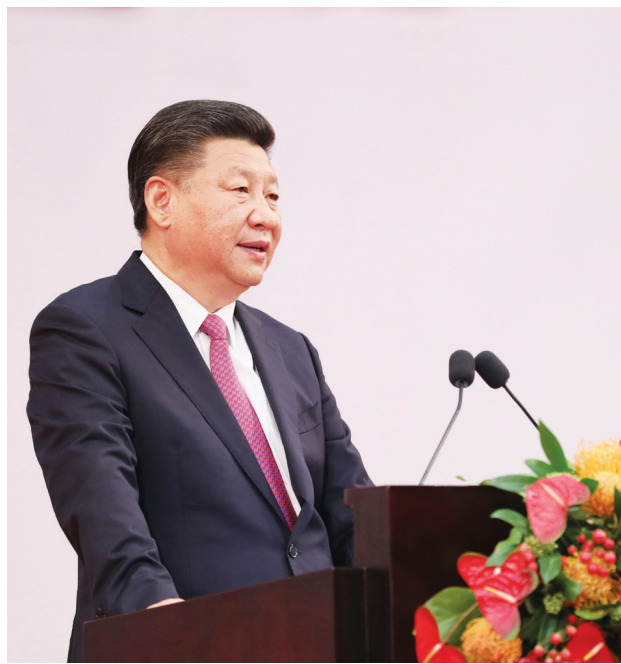
习近平发表重要讲话

在热烈的掌声中,习近平发表了重要讲话。他指出,香港的命运从来同祖国紧密相连。近代以后,由于封建统治腐败、国力衰弱,中华民族陷入深重苦难。只有当中国共产党领导中国人民经