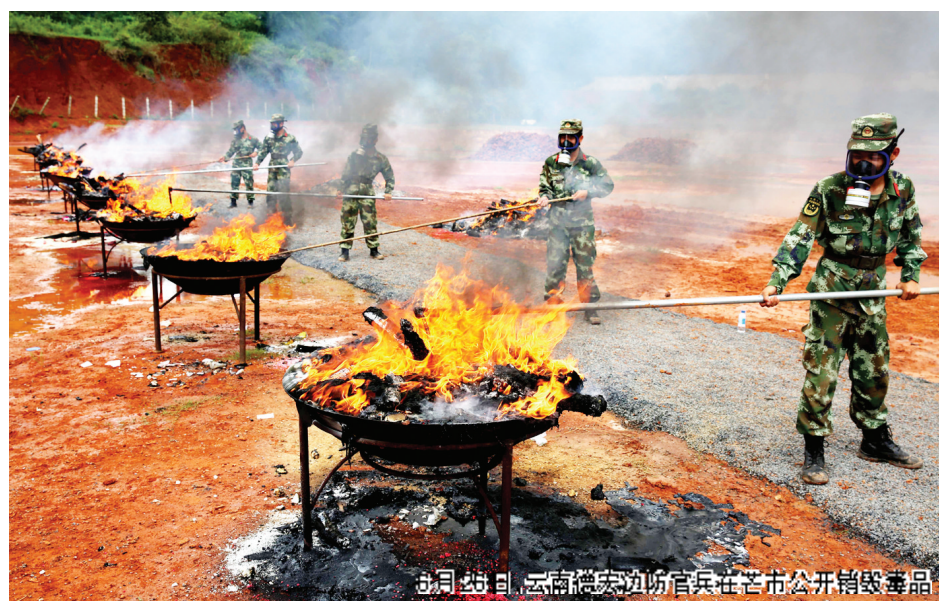
6月26日，云南德宏边防官兵在芒市公开销毁毒品。

在第30个国际禁毒日到来之际，以“健康人生、绿色无毒”为主题的2017中国禁毒论坛日前在北京举行。