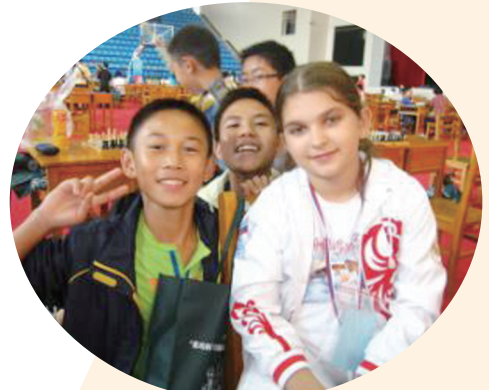
▲与国际友人同场竞技