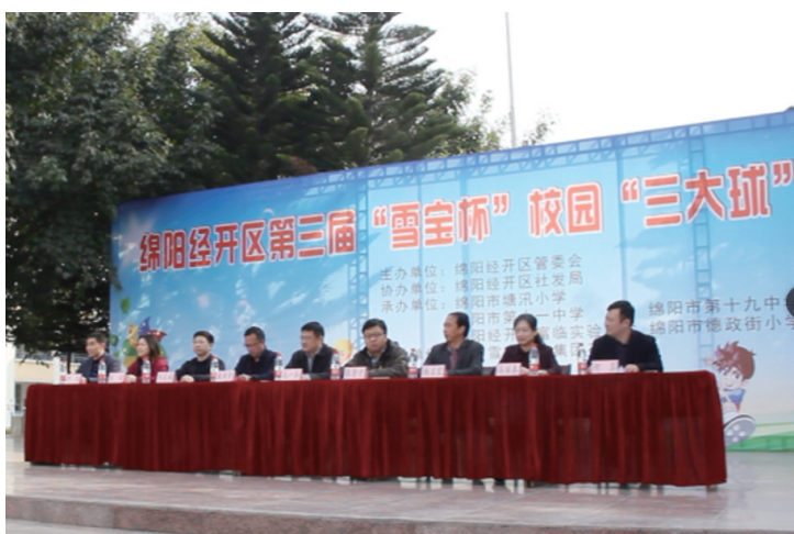
▲经开区领导出席该校“三大球”开幕式