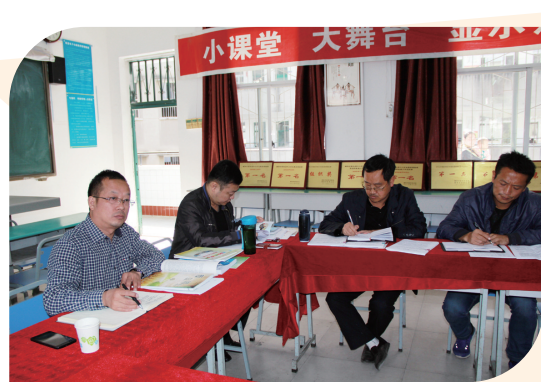
▲经开区领导到校指导工作