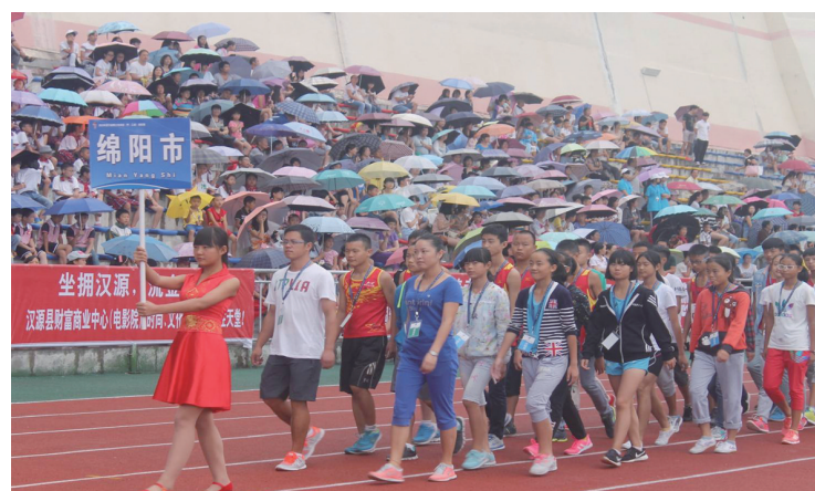
省青少年田径锦标赛获得甲组、乙组团体总分第一

学校在注重教育教学质量上不断向高一一级学校输送人才的同时，携手绵阳中学等学校共同发展特长项目，积极实施学校品牌向高等教育领域延伸，全力贡献优秀教育资源，打造西部基础教育旗舰，为绵阳教育体育事业的发展作出巨大贡献。