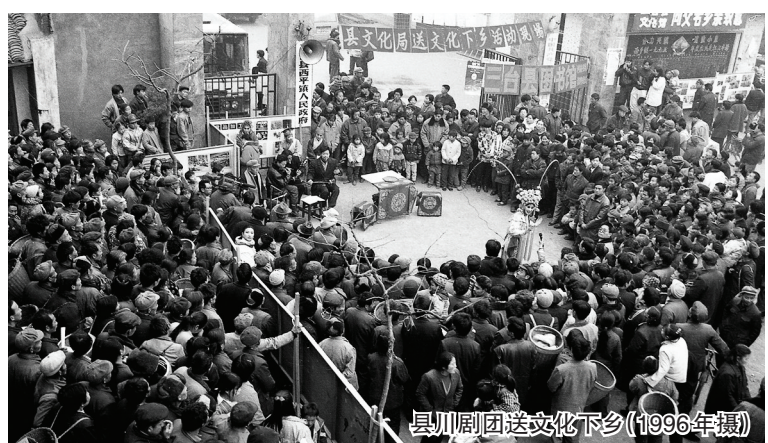
县川剧团送文化下乡(1996年摄)

“如果这本画册，能唤起老三台人曾经的记忆，让新三台人了解三台城市的变迁，从而更加热爱这座城市、呵护这座城市、建设这座城市，那我便感到十分满足了。”如今，古稀老人依旧继续拍摄三台，从黑白到彩色照片，从胶片机到单反再到无人机航拍，这位曾经的异乡人，用手中的相机表达着对第二故乡的深爱之情。