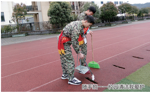
随手拍——校园清洁我爱护

本报讯 为教育和引导学生共同关注文明礼仪,规范学生的行为习惯,树立规则意识、安全自律意识,自4月13日起,绵阳职业技术学院中专教学部“文明行为随手拍”活动正式启动。