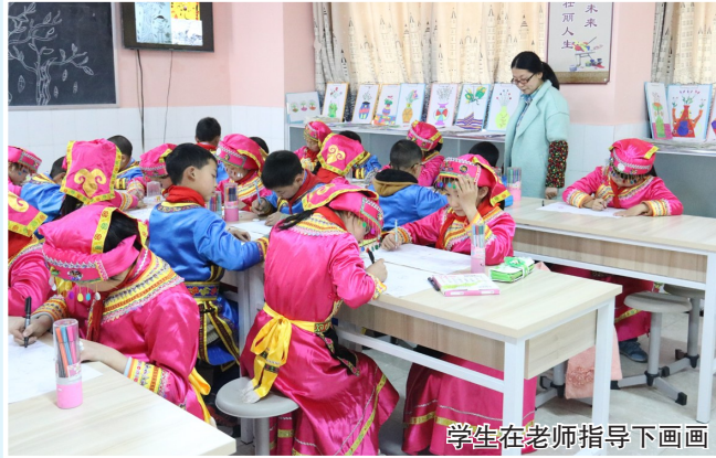
学生在老师指导下画画