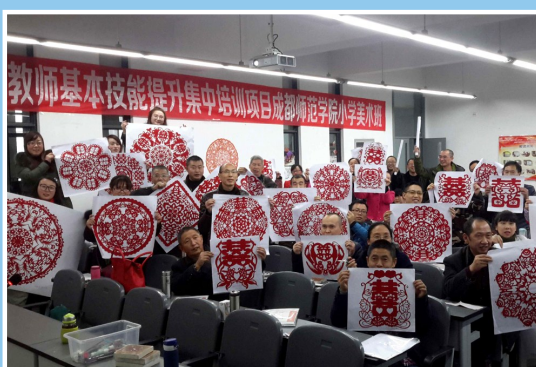
教师基本技能提升集中培训