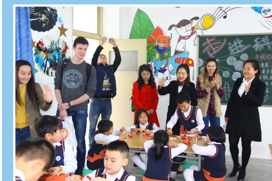
我市中外学生文化交流活动现场