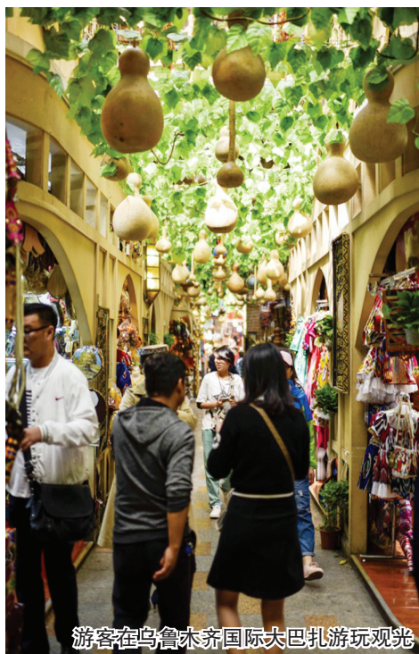
游客在乌鲁木齐国际大巴扎游玩观光