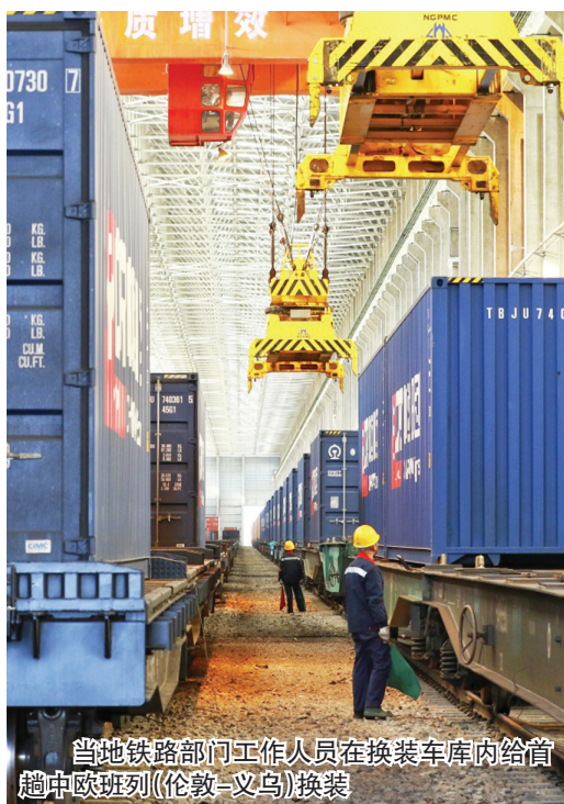
当地铁路部门工作人员在换装车库内给首趟中欧班列(伦敦-义乌)换装

黄沙漫漫，驼铃阵阵；海浪阵阵，帆船点点。在漫长的历史岁月里，留学生始终是中外交流史上的一支重要的力量。“一带一路”倡议提出之后，沿线国家成为来华留学的发力点。目前，“一带一路”沿线国家在华留学生数量已突破20万人。