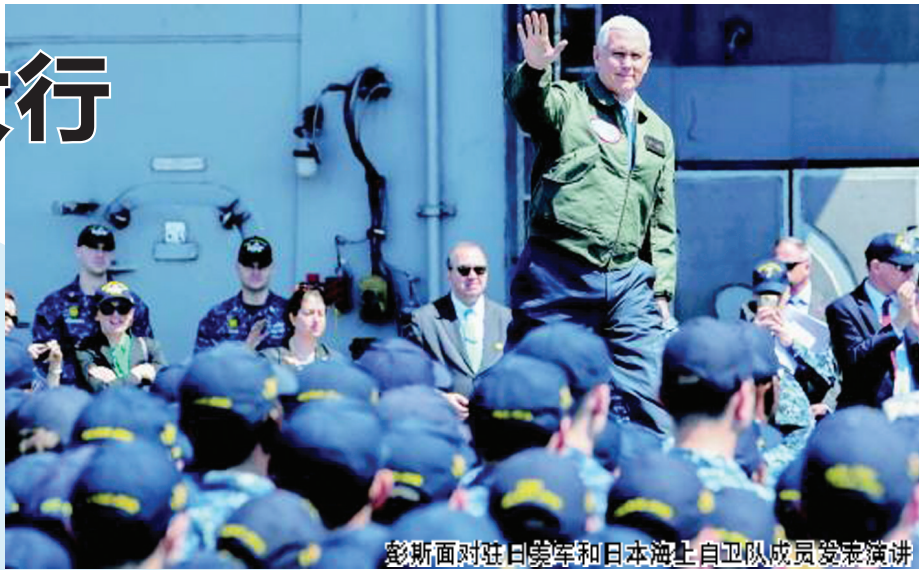
彭斯面对驻日美军和日本海上自卫队成员发表演讲

当地时间23日，美国副总统彭斯在澳大利亚结束其亚太四国之旅，返回美国。这是特朗普政府高级官员在3个月内第三次造访亚太地区。 彭斯此次走访了韩国、日本、印度尼西亚和澳大利亚。分析人士指出，彭斯此访议题除朝鲜半岛问题外，还重申了美国对亚太盟友的安全承诺。