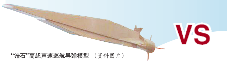
“锆石”高超声速巡航导弹模型 (资料图片)

俄罗斯为什么要开发“锆石”反舰导弹?“锆石”能否击穿以美国“宙斯盾”为代表的防御系统?