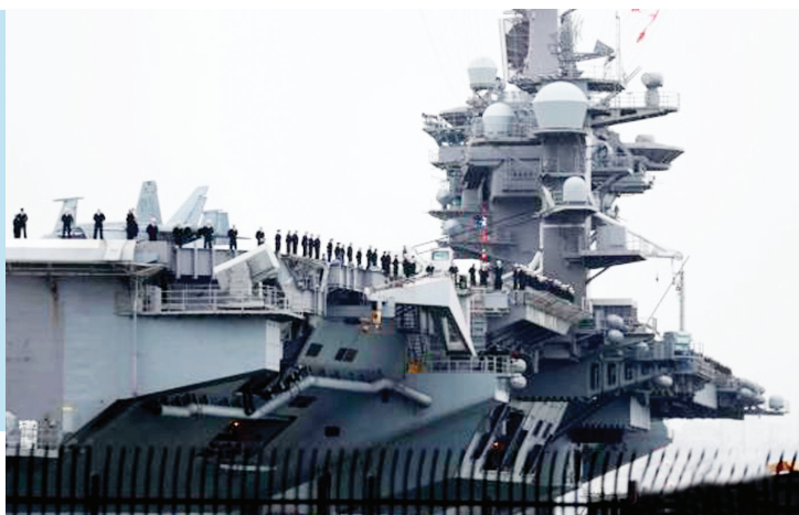
“卡尔·文森”号航母 (资料图片)