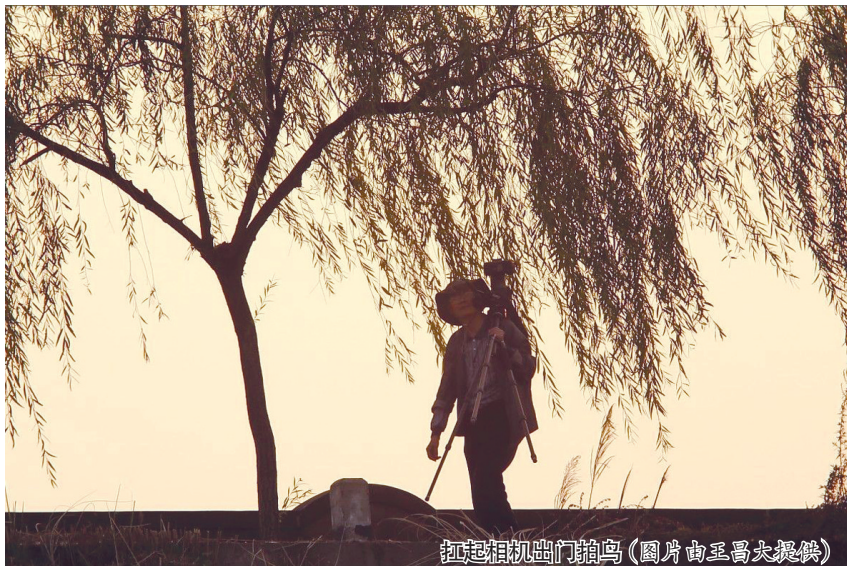
绵阳越州机场门前拍鸟

类摄影大赛，他累计上传图片超过1.1万张，他拍摄的照片也被许多鸟类图书所收录。王昌大因此被称为“中国鸟种拍摄数量最多的人。”