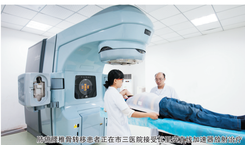
肺癌腰椎骨转移患者正在市三医院接受瓦里安直线加速器放射治疗

市三医院肿瘤科主任贾霖表示,如果说放疗是一把“枪”,那么如何精确瞄准到癌细胞而不伤及正常细胞,一直是一个重要的医学课题。“精确放疗”是用“狙击枪”去攻击目标,能“完美”避开正常组织,射线只针对肿瘤病灶进行放射治疗,使误差精确到毫米级,让肿瘤“走投无路”。这样不仅提高放疗的局控率,让肿瘤治疗区域更加准确,损伤更小,而且减轻了放疗副作用,使患者能够轻松完成放疗疗程,实现最佳的