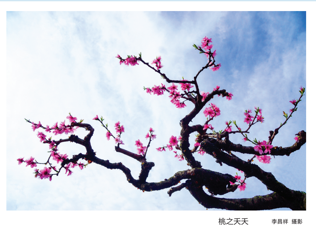
桃之夭夭

从天边飘来的云朵，经香味一熏就变得洁白。这都不是重点。那些跋山涉水而来，看过双沙菜花的人，不会再患上营养不良。