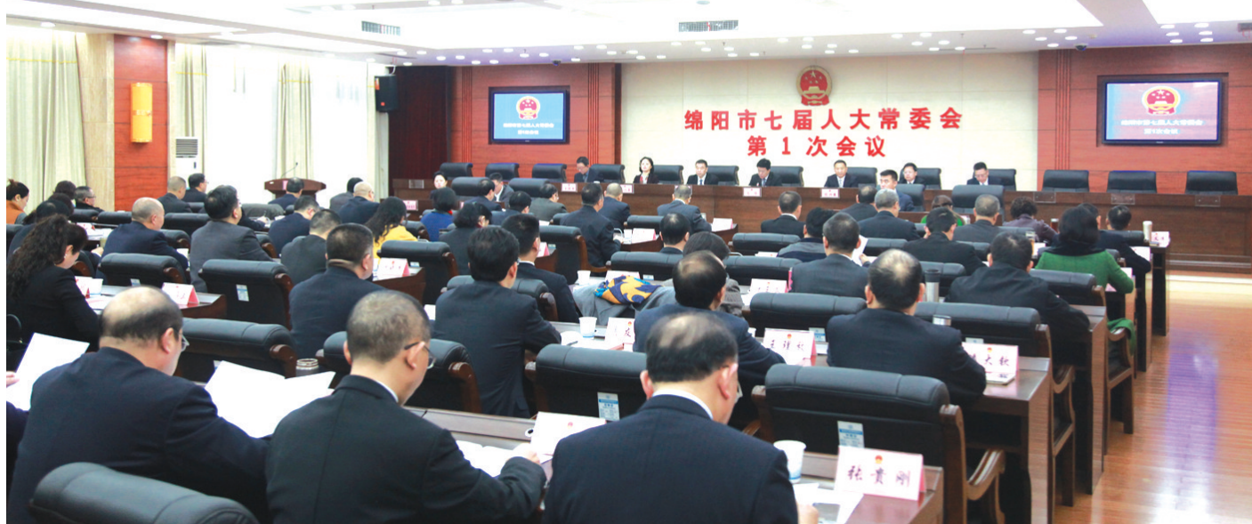
市七届人大常委会第一次会议

加强财经审查监督。坚持抓好计划和预算草案初审，对市级部门预算进行专题审查，提高预算编制的科学性和准确性。加强预算调整的审查监督，维护预算的刚性约束，提高财政资金使用效益。听取和审议市级预算执行和其他财政收支审计查出问题整改情况报告，要求加强预算单位的业务指导和培训，建立和完善内控制度、审计整改销号制度，强化限期整改并持续跟踪抓落实。为督促审计查出问题的整改，组织开展对审计查出问题整改情况的专题调研，督促完善管理制度，加强源头治理和防范。