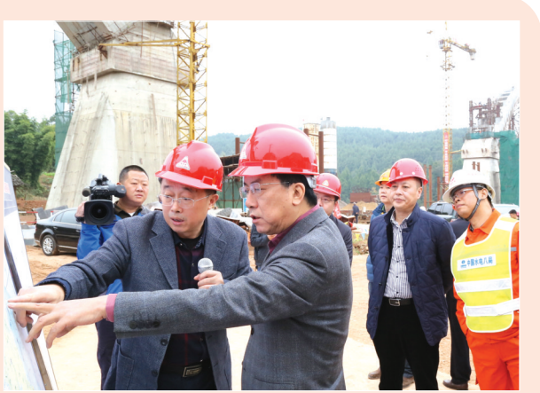
调研武引二期灌区工程建设