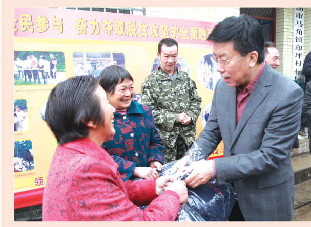
指导脱贫攻坚、慰问困难群众

配合上级人大立法工作。协助完成全国人大对核安全法、水污染防治法，省人大对水利工程管理条例、多元化解纠纷促进条例、非物质文化遗产保护条例的立法调研工作，既加强工作联动，又积累立法经验。