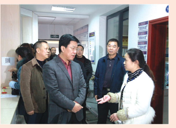
调研社区工作、慰问社区干部