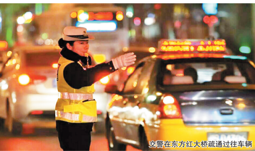
交警在东方红大桥疏通过往车辆

本报讯(记者 李锦辉 文/图)昨(20)日,记者从市公安局交警支队了解到,自涪江三桥(富乐大桥)封闭施工以来,交警部门对主城区前往我市各交通要道进行分流疏导。目前,交警部门已制定了详细的交通组织方案,昼夜不停地坚守在各个分流点,确保市民出行便捷。