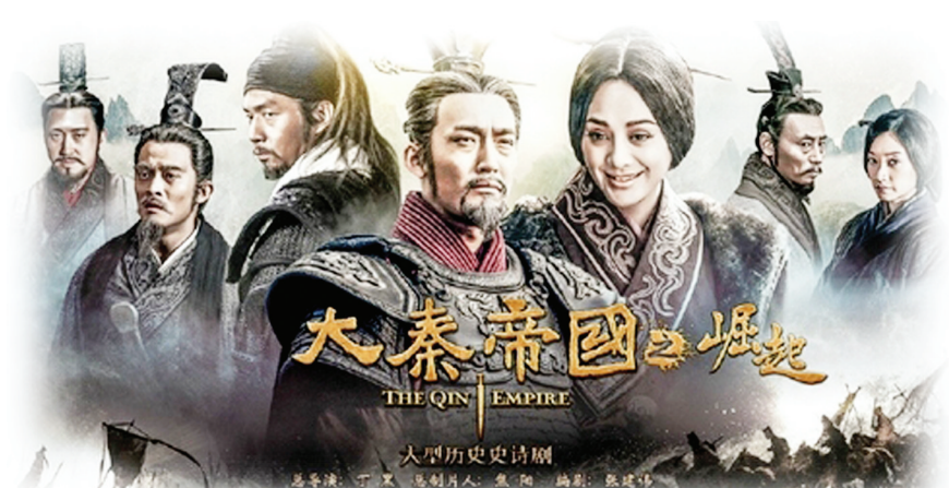
《大秦帝国之崛起》海报

律,在上周四晚距离首播仅剩4个小时才通过官方微博宣告开播,被观众们调侃为“零宣传”。