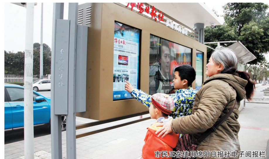
市民正在使用绵阳日报社电子阅报栏

据绵阳日报社相关负责人介绍,此次投放使用的多媒体电子阅报系统主要分布在绵绵路、晶蓝湖小区广场、板桥社区文化广场、沈家坝北街社区广场、铂金时代小区广场、外国语学校、沈家坝北街社区办事处以及五里堆汉城社区广场等处。绵阳日报社多媒体阅报系统集平面媒