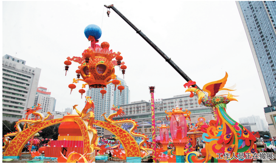
工作人员正在撤展

本报讯(记者 赵焯文 实习记者 任露潇)“连续几个晚上,我都和家人一起来逛逛灯展,每个区各有千秋,这两年灯展的水平越来越高,看都看不过来。”元宵当晚,随着“2017幸福美丽绵阳”迎春灯展落幕,走出人民公园的市民陈东家仍意犹未尽。昨(13)日,记者从市人民公园管理处获悉,灯展现场已开始撤展,灯展期间共吸引上百万人次赏灯游园。